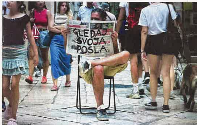
■ Boris Burić, 'Gledaj svoja posla', 2025.; Neli Ružić Ana, videoinstalacija