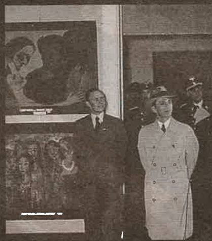
Joseph Goebbels tijekom posjeta izložbe, 1937. godine

Rat modernoj umjetnosti nacisti su proglasili 1933. godine i zaplijenili preko 15.000 nenjemačkih umjetničkih djela iz njemačkih muzeja i privatnih zbirka