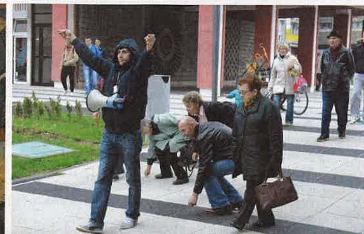
■ Antun Mezdijć, 'Radnik s pregačom', 1931.; Marijan Detoni, 'Prehrana', NMMU; Gildo Bavčević, 'Padaj silo i nepravdo', 2013.