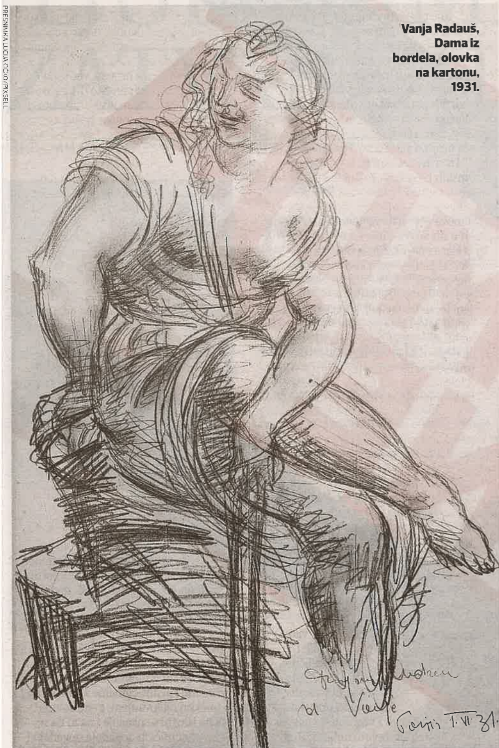
Vanja Radauš, Dama iz bordela, olovka na kartonu, 1931.